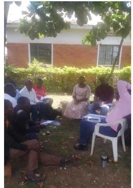
Bei der Mitgliedsversammlung

Mit neuer Motivation gab es bereits die ersten Arbeitseinsätze der tierärztlichen Kollegen und Paravets in der Community. So wurden selbstständig Bullen kastriert, Rinder enthornt und gegen Parasiten behandelt, wie wir es in der Vergangenheit in den tierärztlichen Kursen erlernt und trainiert hatten - eine nachhaltige Arbeit also, die nun von den lokalen Mitarbeitern vor Ort in Eigenregie durchgeführt werden kann.