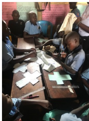
Herstellung von wiederverwendbaren Pads