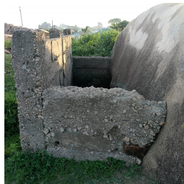
Der aktuelle Abort

Wir hoffen auf Eure/Ihre Unterstützung, um der Schule weiterhin die Chance zu geben, die Inselkinder mit einer angemessenen Bildung und wenigstens basalen hygienischen Bedingungen zu versorgen.