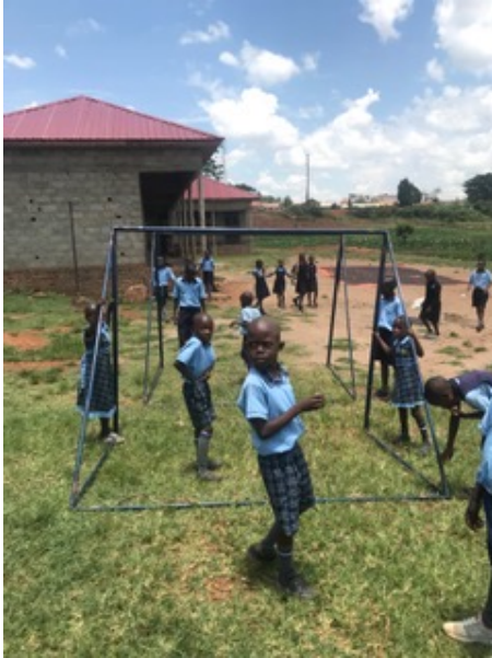
Gedeckter Neubau im Hintergrund + neue Fuß-