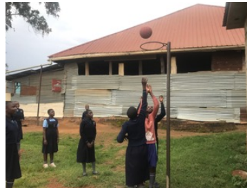
Neue Netball-Körbe auf dem Schul- hof

Dank unglaublicher Anstrengung und unserer, durch das grandiose Fundraising der „Tagträumer e. V.“ aus Münster ermöglichten Unterstützung sowie unserer vereinseigenen Spenden von PUC, konnte vor der nächsten Regenzeit im Oktober 2023 das Dach gerüstet und eingedeckt werden.