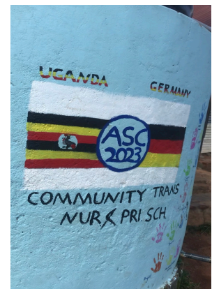
Kunstprojekt der Workshopwoche

Alles in allem also ein überaus erfolgreiches Jahr für die „Community Trans“, wofür wir allen Unterstützern im Namen der Schülerschaft und Lehrkräfte aus Iganga ganz herzlich danken!