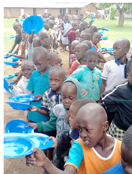
Anstehen für die warme Mahlzeit

Außerdem bekamen die Lehrkräfte der Schule einen kleinen Zuschuss zu ihrem kümmerlichen Gehalt, die Kinder, die bisher den ganzen Tag mit leerem Magen in der Schule verbringen mussten, können nun einmal täglich mit einem warmen Porridge versorgt werden (s. Foto: In langer Reihe stehen sie an, um ihre warme Mahlzeit in Empfang zu nehmen.) Nun gibt es dank der Spende von PUC auch Geschirr an der Schule! Sowie an besonderen Tagen sogar ein kleines Mittagessen, bestehend aus Posho (Maisbrei) und Bohnen.