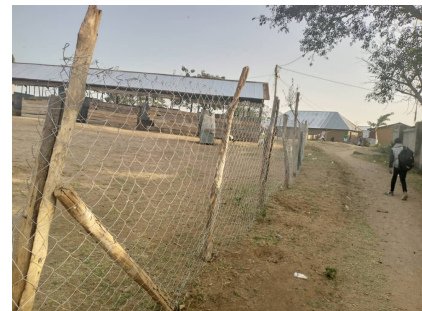
Neuer Zaun um die Schule

Außerdem bekamen die Lehrkräfte der Schule einen kleinen Zuschuss zu ihrem kümmerlichen Gehalt, die Kinder, die bisher den ganzen Tag mit leerem Magen in der Schule verbringen mussten, können nun einmal täglich mit einem warmen Porridge versorgt werden (s. Foto: In langer Reihe stehen sie an, um ihre warme Mahlzeit in Empfang zu nehmen.) Nun gibt es dank der Spende von PUC auch Geschirr an der Schule! Sowie an besonderen Tagen sogar ein kleines Mittagessen, bestehend aus Posho (Maisbrei) und Bohnen.